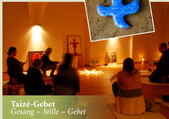
Taizé-Gebet Gesang – Stille – Gebet

DO / 12.11. / 19.30 Uhr / Meditationsraum